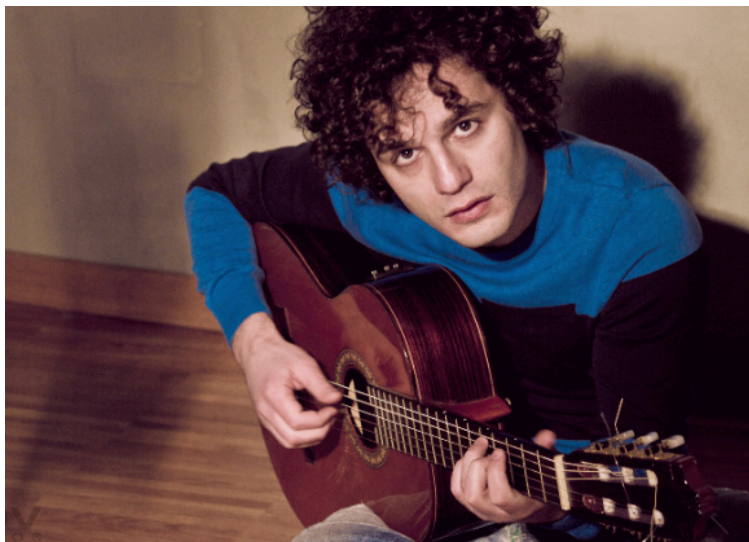
Premio Mauro Carratta, Premio Stefano Rosso.